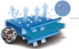
5 LAYER SPUNBOND

Gaun Bedah Sekali Pakai kami dibuat dengan menggunakan 5 lapis spunbond (SMMMS) yang sudah anti-statis, anti-darah, anti air dan dibungkus dalam plastik sehingga terjaga kebersihannya. Produk ini akan mendukung kinerja setiap petugas medis. Produk ini sekali pakai, sehingga sangat praktis dan higienis.